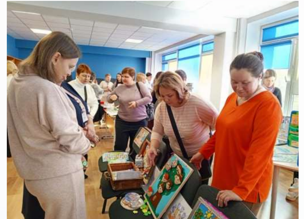
Представление материалов на региональном уровне