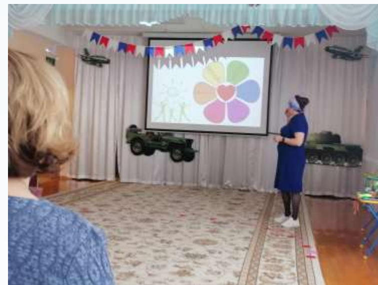
Опыт публичного выступления