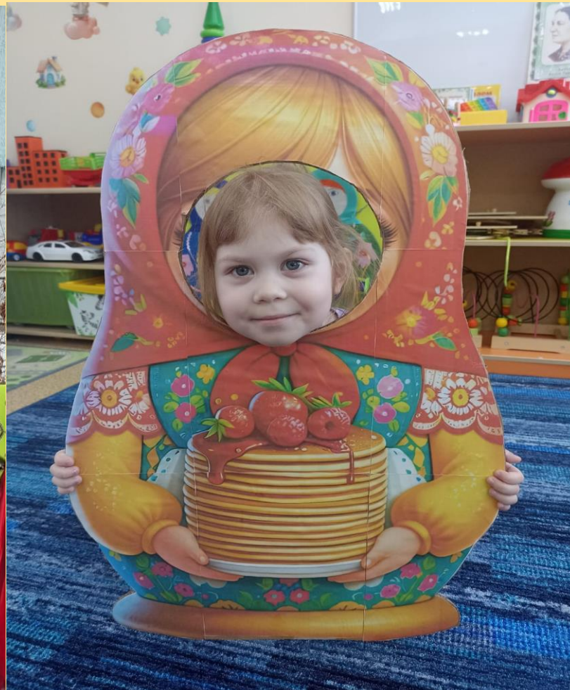
Изготовление куклы масленицы