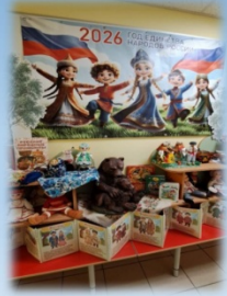
Холлы второго этажа