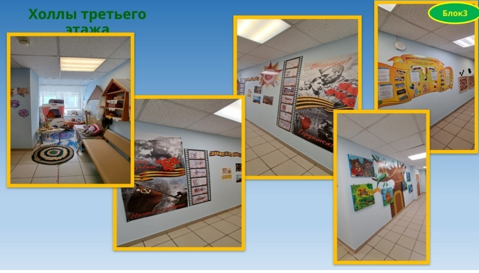
Холлы третьего этажа